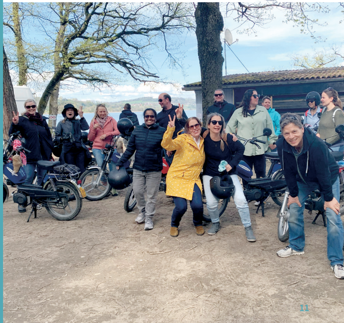
Mit dem Mofa um den Murtensee | Teamausflug